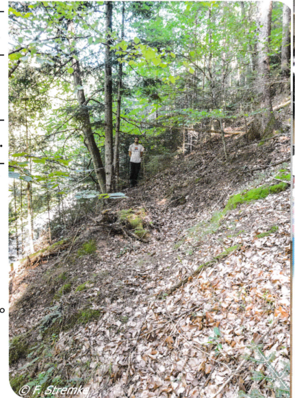
Als Geländekante erkennbare Trasse von Wasserleitung 2 oberhalb des Ortes Kirchberg am Wechsel.

Der Versuch hat gezeigt, dass die römische Goldwaschmethode sehr effizient war und die Verluste vernachlässigbar waren. Diese Erkenntnis macht deutlich, warum die Goldgewinnung für die Römer selbst bei Lagerstätten mit geringem Goldgehalt, so wie die Loipersbach-Formation, gewinnbringend war. Die römische Waschrinne wurde dem Museum Neunkirchen übergeben, wo sie demnächst bewundert werden kann. Auf einer Schautafel soll die Verwendung der Rinne in Wort und Bild erklärt werden. Sollte dieser Beitrag Ihr Interesse an der fast 2000 Jahre alten Bergbaugeschichte des „Karth“ geweckt haben, würden wir uns freuen, wenn Sie unsere Website ( www.karthgold.com ) besuchen würden, um über den Fortschritt unserer Arbeiten auf dem Laufenden zu bleiben. Auf der Startseite finden Sie ein erstes kurzes Video von Rick Spurway, unserem Dokumentarfilmer, in dem das Projekt filmisch vorgestellt wird. Unter „Aktuelles“ finden Sie kurze Texte zu den laufenden Arbeiten und in der Galerie gibt es viele Fotos und ein kurzes Video zu unserem Goldwaschversuch.