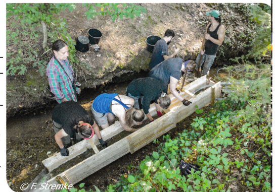
Der Betrieb der rekonstruierten römischen Waschrinne.